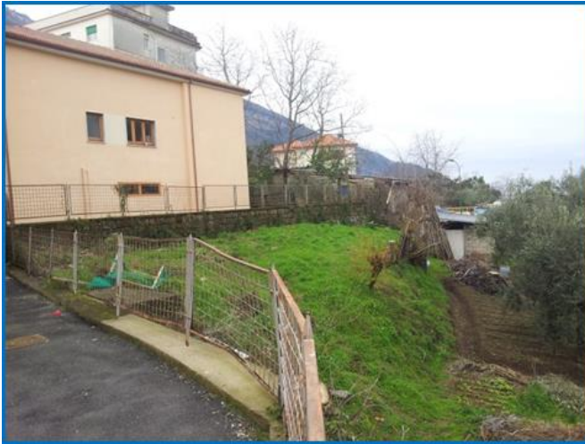
PRIMA DELL' INTERVENTO