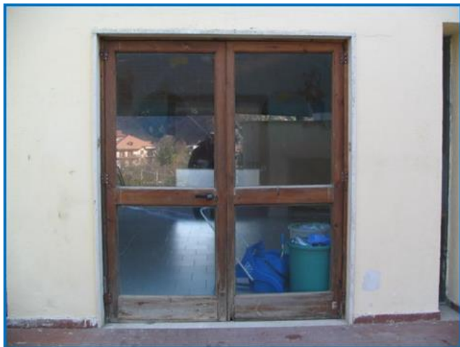
PRIMA DELL' INTERVENTO